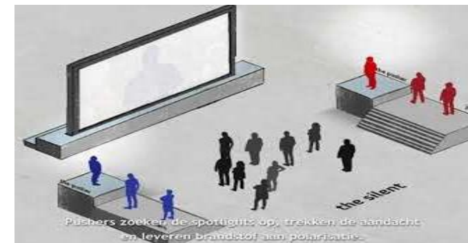
Drieluik polarisatie, deel 2

De vijfde rol is die van de ' zondebok ' ( scapegoat ). Als de polarisatie excessief toeneemt, vergroot dat de kans dat er een zondebok wordt gezocht. Mensen die nog in het sterk uitgedunde midden staan, worden door beide partijen als vijand gezien. Ook de bruggenbouwer, die zelfs in vredetijd al niet werd vertrouwd, komt in aanmerking voor de rol van zondebok.