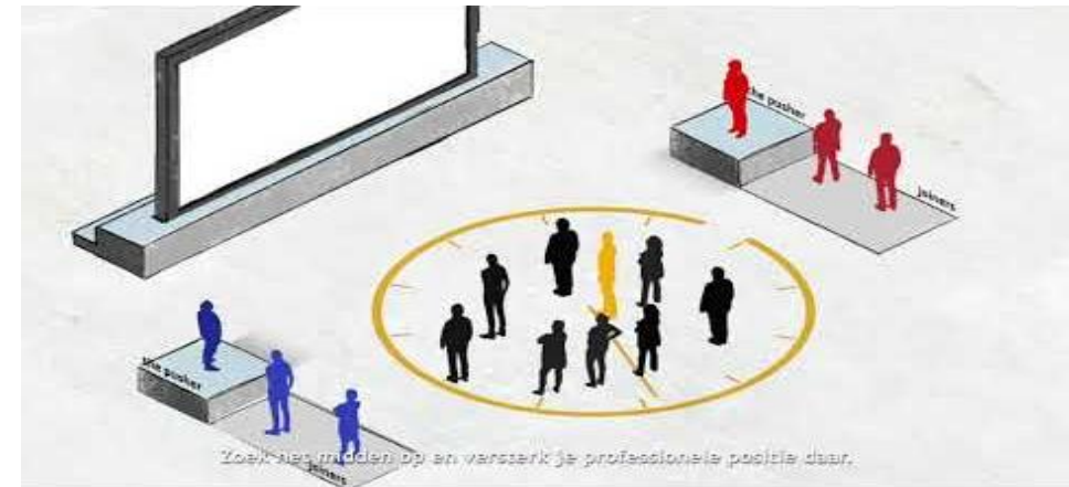
Drieluik polarisatie, deel 3.