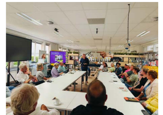
Gemeenteraad Bergen op Zoom op bezoek