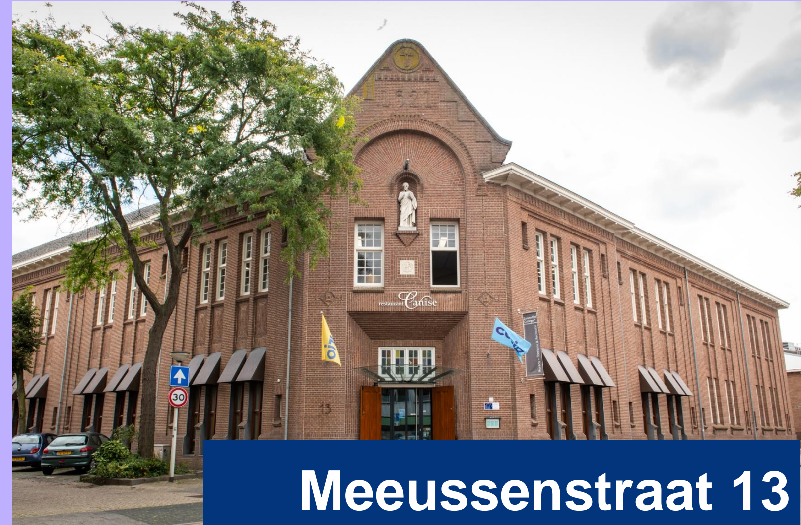
Meeussenstraat 13 Bergen op Zoom