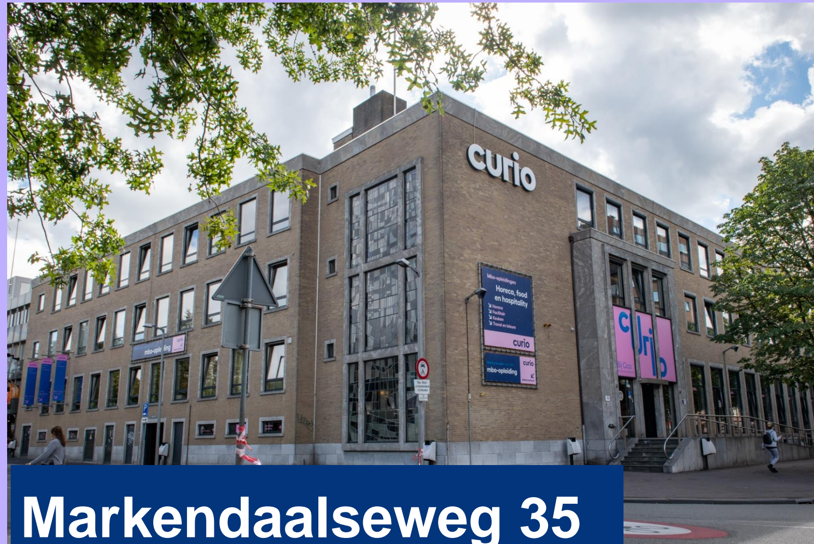
Markendaalseweg 35 Breda