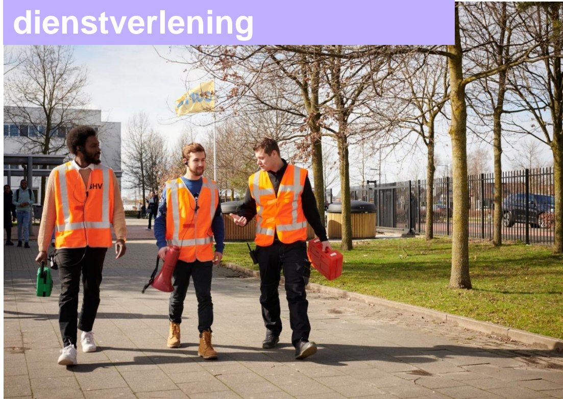
Medewerker facilitaire dienstverlening