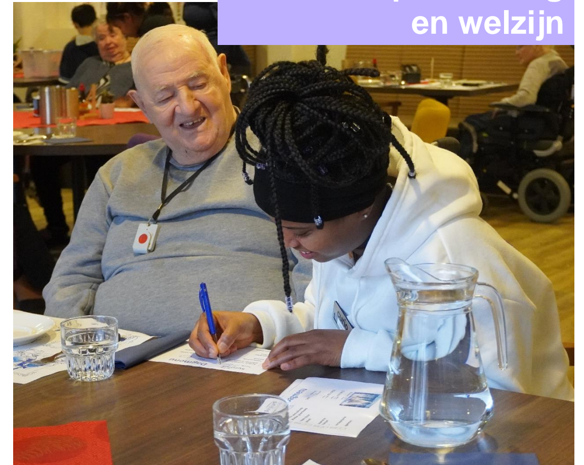
Helpende zorg en welzijn