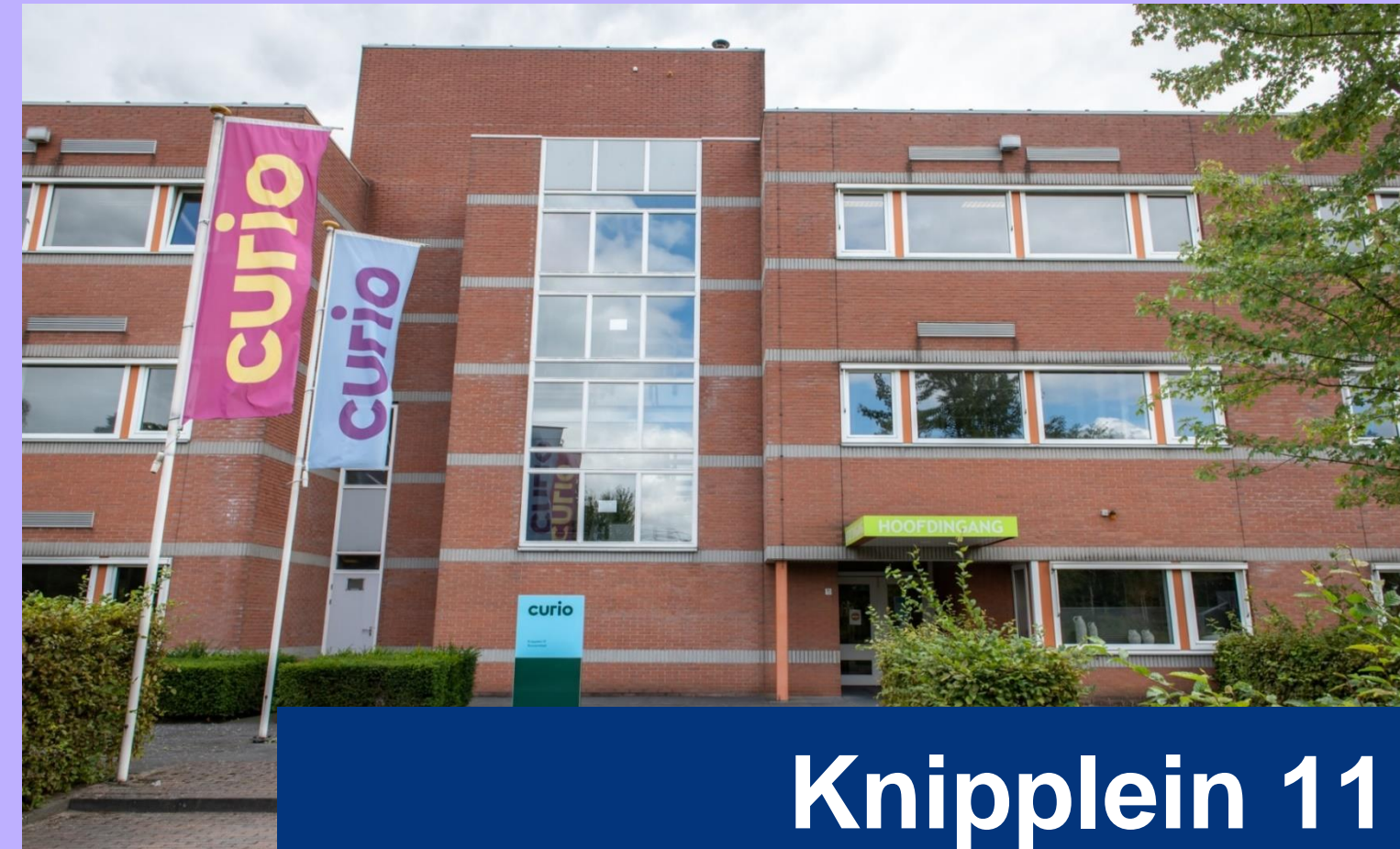
Knipplein 11 Roosendaal