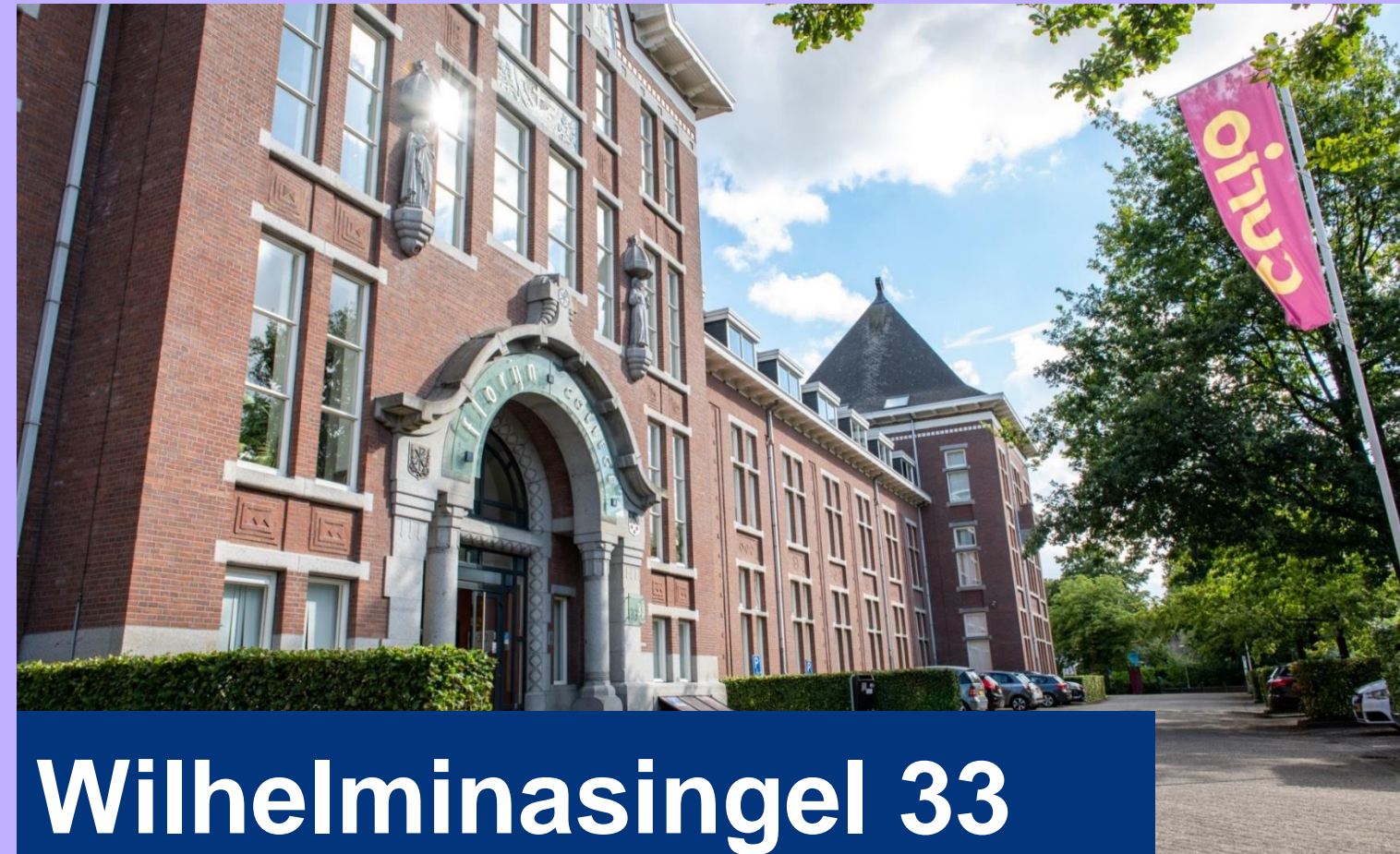
Wilhelminasingel 33 Breda