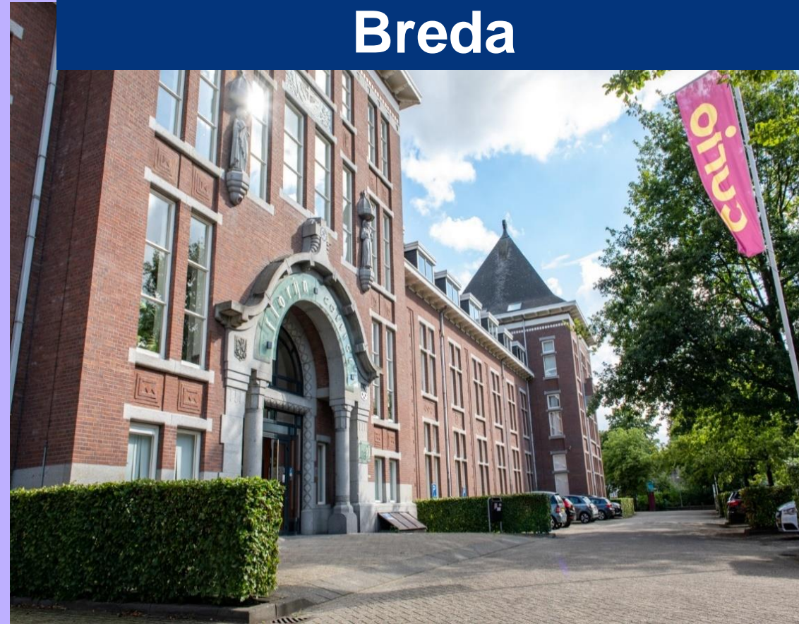
Wilhelminasingel 33 Breda