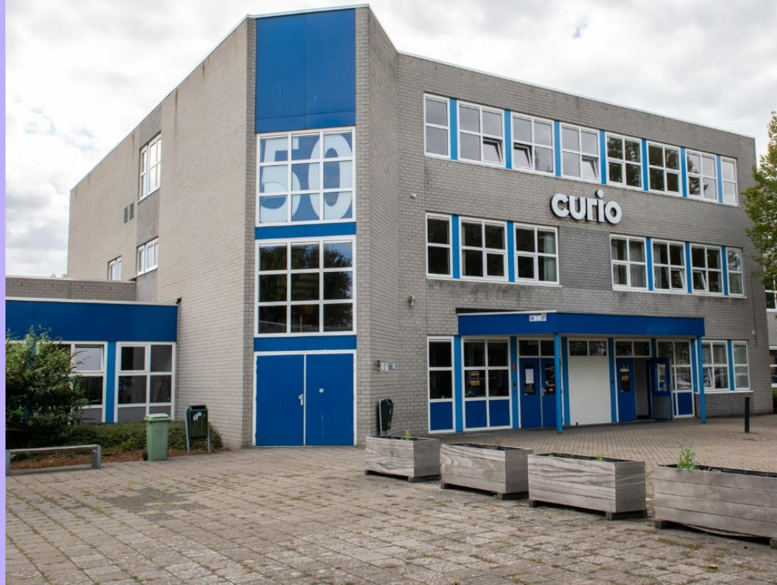
Nobellaan 50 Bergen op Zoom