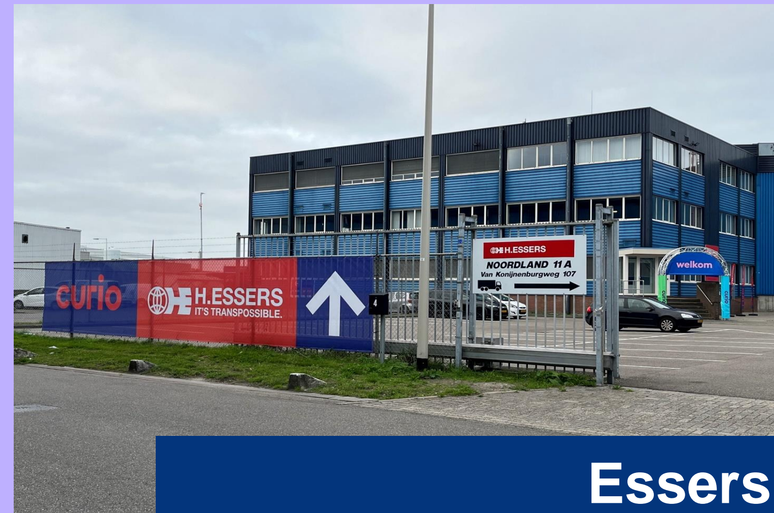
Essers Bergen op Zoom