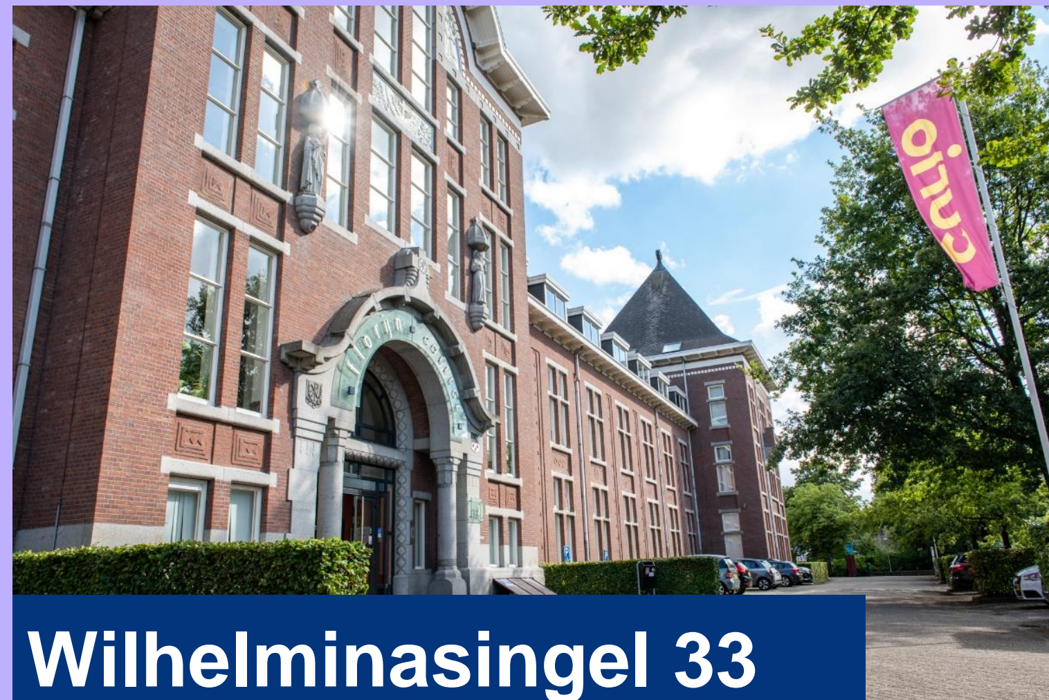
Wilhelminasingel 33 Breda