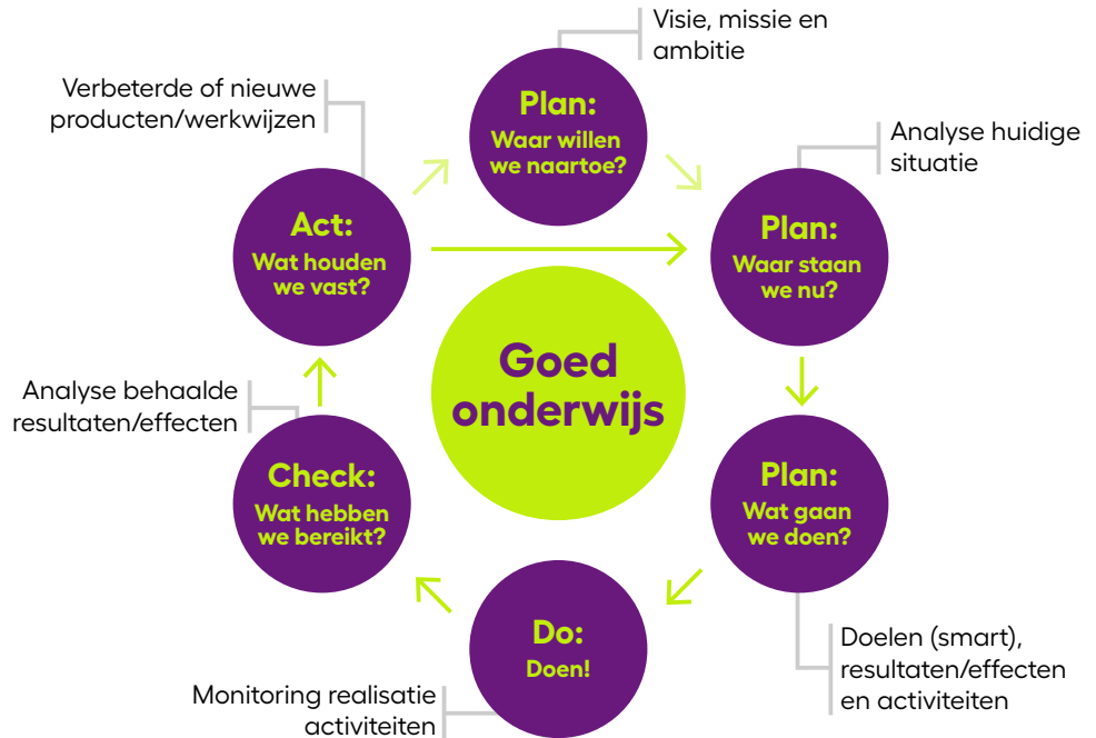
Afbeelding 2: proces kwaliteitszorg