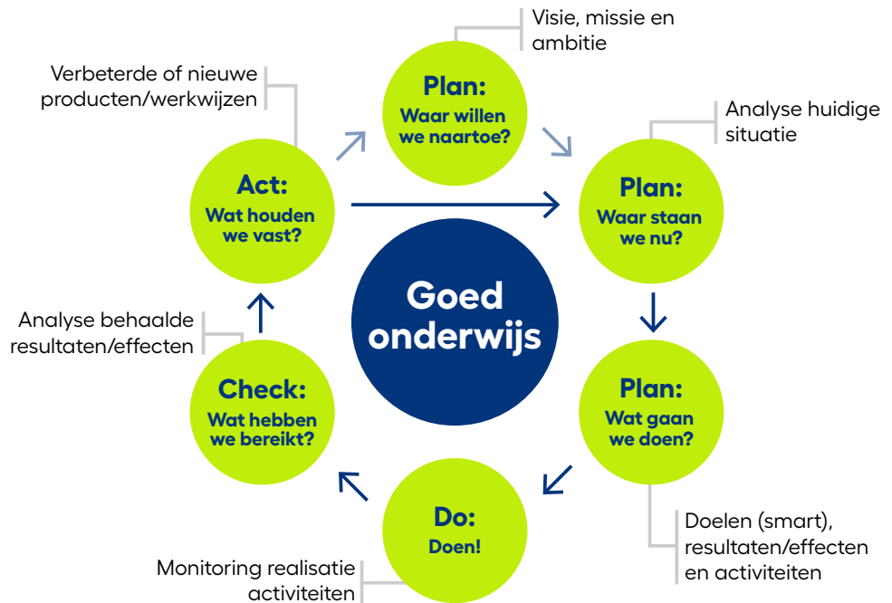
Afbeelding 2: proces kwaliteitszorg